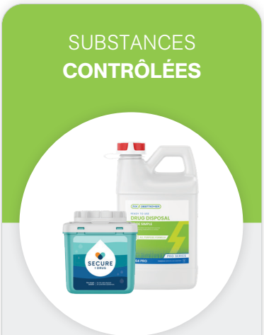
Contenant Secure a Drug ou Rx Destroyer

Médicaments classés comme substances contrôlées par Santé Canada (narcotiques, opioïdes, etc.)