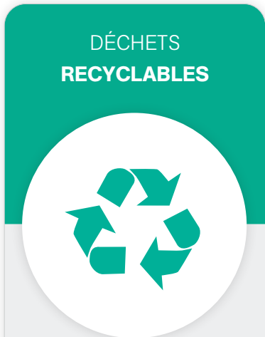
Bac de recyclage

Articles en papier, plastique et métal destinés au recyclage.