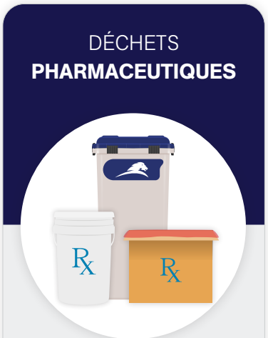
Contenant blanc pour objets perforants avec couvercle bleu, seau blanc pour médicaments (Rx), ou boîte en carton avec doublure rouge