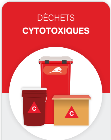
Contenant rouge pour objets perforants, seau rouge ou boîte en carton avec doublure rouge