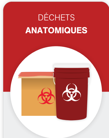
Seau rouge ou boîte en carton avec doublure rouge

Tous les tissus humains et animaux, organes et parties du corps, à l'exception des cheveux, ongles et dents.