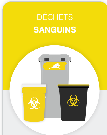
Contenant gris ou seau/sac jaune

Avertissement : Ceci est un GUIDE UNIQUEMENT et est destiné à fournir des renseignements généraux. Les utilisateurs de ce guide sont fortement encouragés à vérifier les règlements locaux applicables.