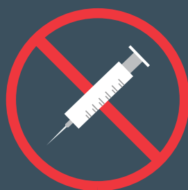
Objets tranchants non sécurisés